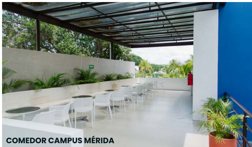
COMEDOR CAMPUS MÉRIDA

EP de Mexico es una Universidad Nacional Privada con registro SEP, con mas de 20 años de trayectoria con Campus en Puebla, Guadalajara, Merida y Monterrey. Que se caracteriza por formar a Directivos y Altos Mandos de diferentes sectores: Servicios, Industria y Salud.