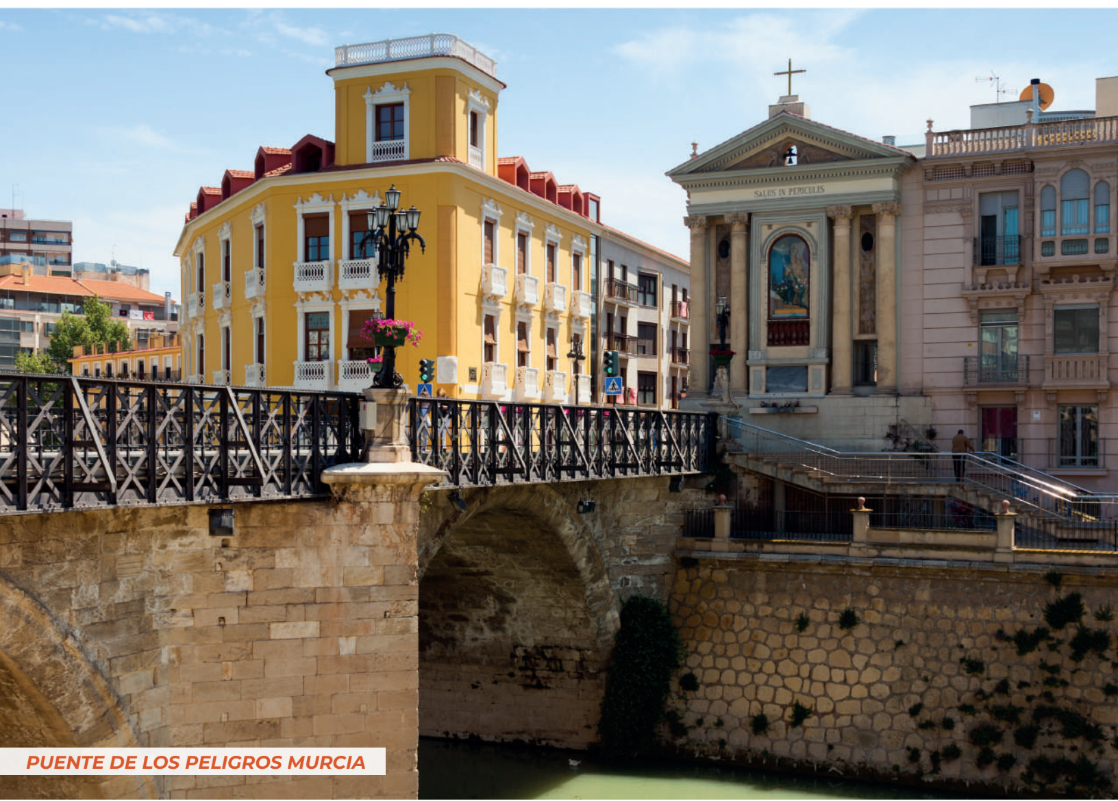
PUENTE DE LOS PELIGROS MURCIA