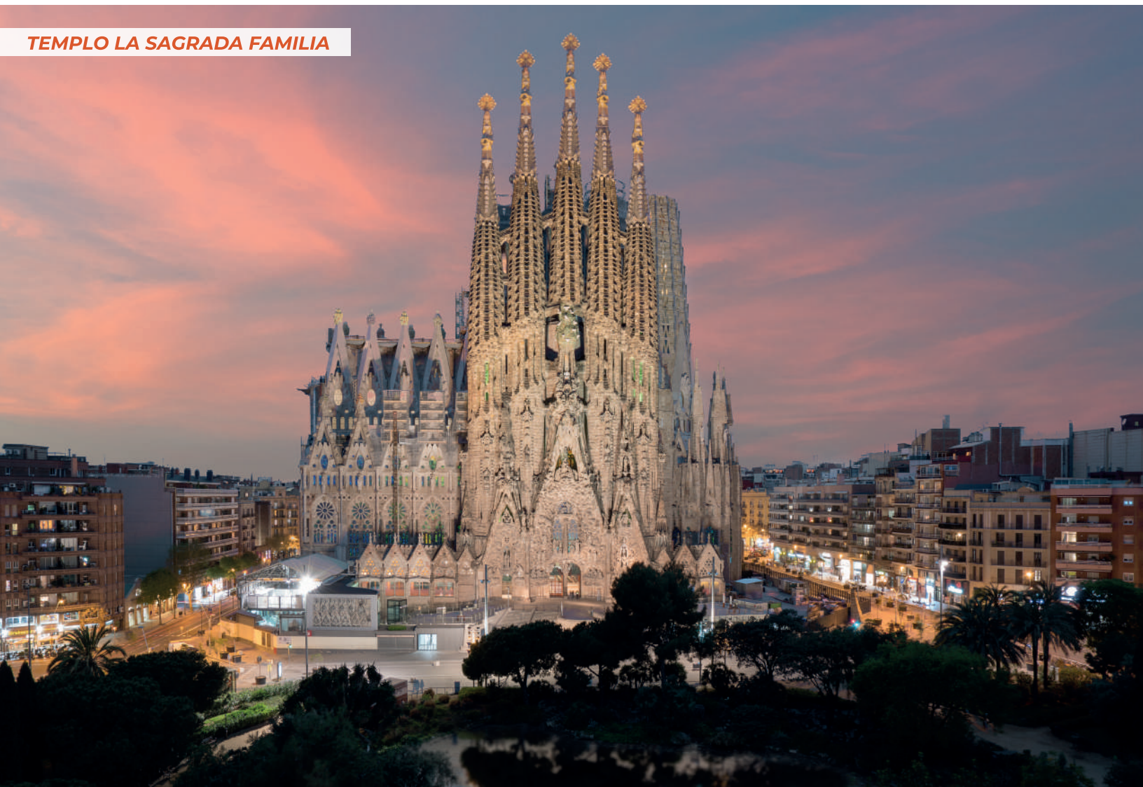
TEMPLO LA SAGRADA FAMILIA